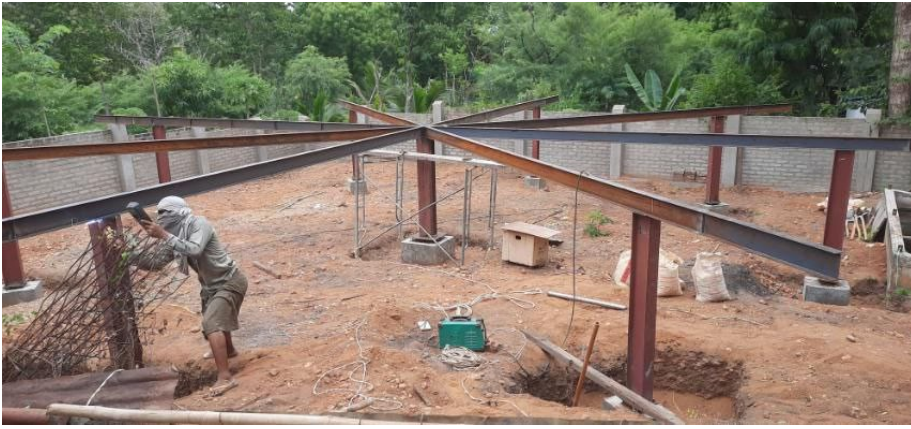
La construction progresse....