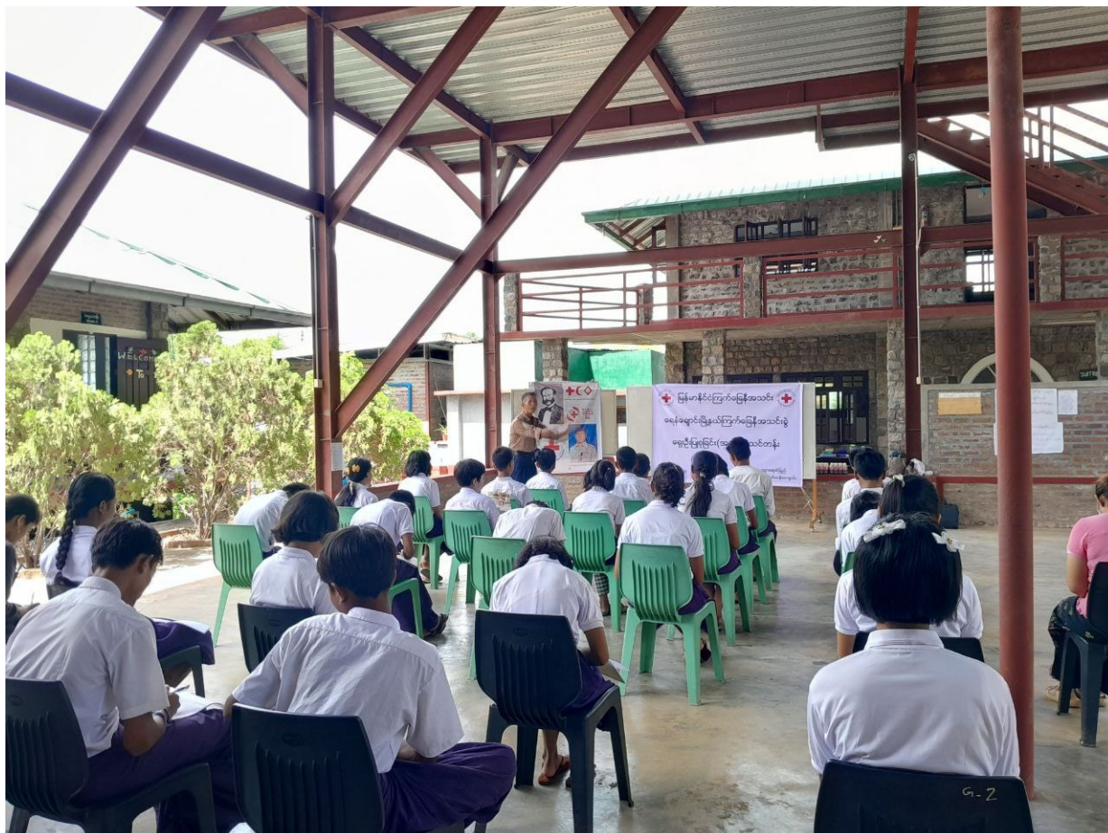
Formation aux premiers secours, en collaboration avec l'équipe de la Croix-Rouge du canton de Yenangyaung