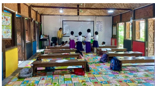
L'ancien bâtiment de l'école maternelle a été rénové : le toit en feuilles de palmier a été remplacé par un toit en zinc, des poutres en acier ont remplacé les colonnes pour rendre la salle de classe plus ouverte, sans restreindre la vue sur le tableau noir et avec plus d'espace pour jouer.